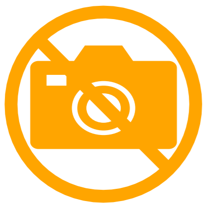
Bild- und Tonaufnahmen am ganzen Standort sind nicht gestattet.

Das Betreten mit einem Herzschrittmacher ist nicht gestattet.